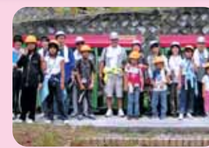
PTAで立山カルデラを見学

地元企業で働く従業員の方から 自分の父親世代の方にもかかわらず、威張った感じも無く、いつも笑顔で私たちと接してくれ気軽に相談にものってもらっています。 【21才男性】