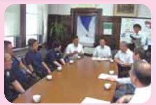
スペシャルオリンピックス会長として県庁を表敬訪問