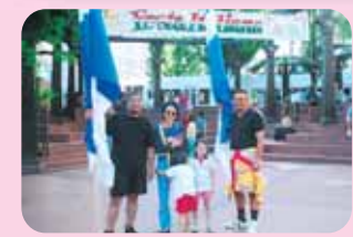
JC 少年の翼の団長としてオレゴンへ

地元自営業の方から 厳しい経営環境の中、地域と子供達の未来のために、正に火中の栗を拾うという決意に深く賛同します。彼は、豊かな識見と鋭い先見性に基づく卓越した実行力を持っています。県政に清新な風を入れ、力強く活躍できると確信します。 【50才男性】