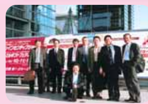
商工会先進地視察

地域でボランティア活動する女性の方から 自分より若い方が県政で活躍して下さるなら、こんな安心はありません。地元を大切に、人を大切に下さる方なので、ぜひともがんばって下さい。 【56才女性】